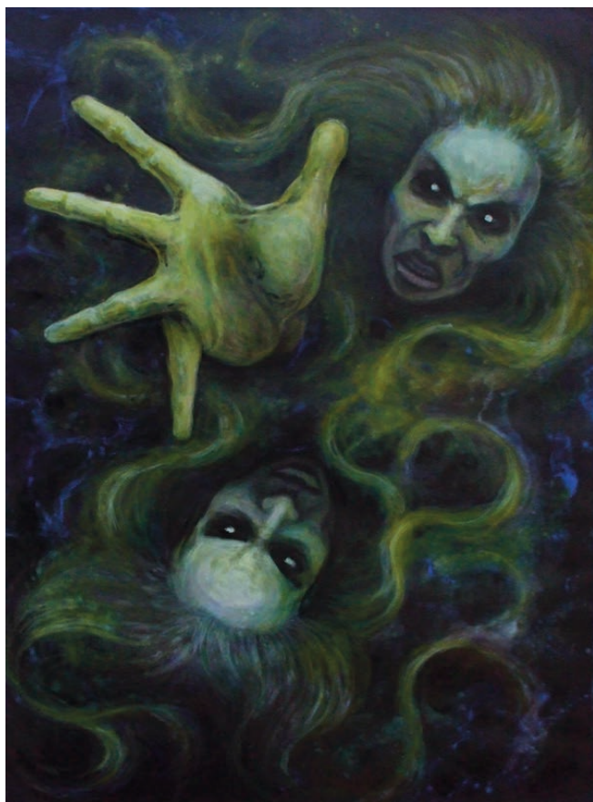
Kaposi Eszter: Az ikrek

Ó, Isten, ha vagy. Add meg nekem! Ne veszítsem el a kedvesem! Ó, Isten, ha vagy. Szeress nagyon! Ne büntess, ha mégis elhagyom! Ó, Isten, ha vagy. Te jól tudod, Szeretni a legnagyobb dolog. Ó, Isten, ha vagy. Taníts meg engem! Ne hagyj elveszni a szerelmem! Emeld fel hát áldott kezed, s szeresd Őt nagyon, ha nem leszek.