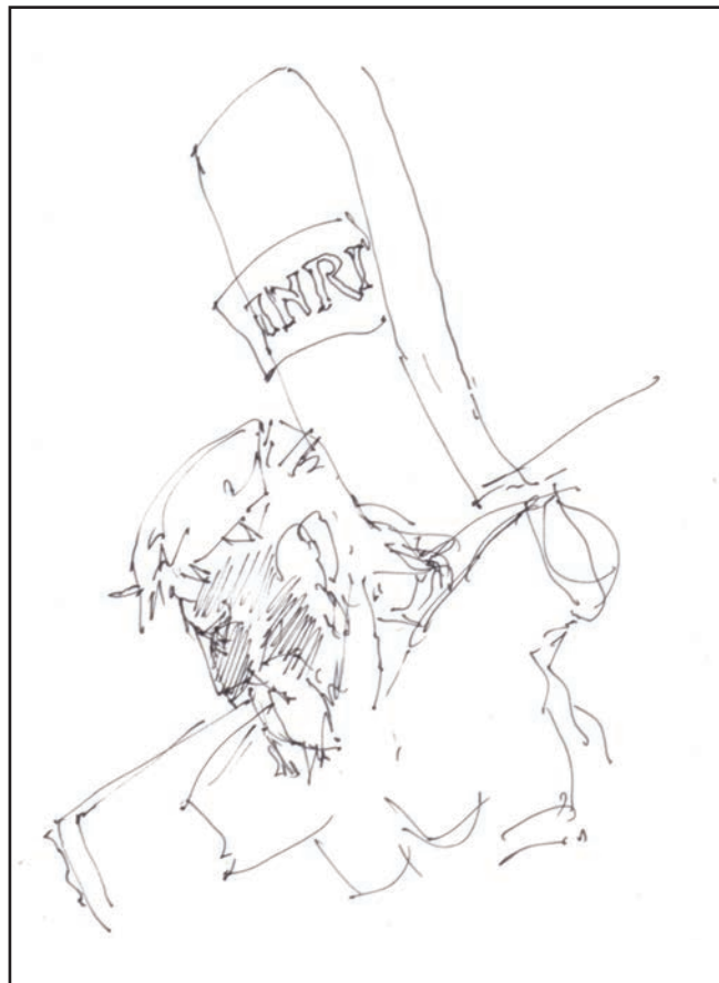
Votin József: Korpusz, 2010

– Folytasd, Zsófi, te meg, lányom, üljél le! – hallottuk a megfellebbezhetetlen tanári felszólítást. A lány lehupant a helyére, miközben az őt követő erélyes tekintet áthelyeződött Zsófira. A kócos hajú lány pedig felelt. Hangja betöltötte az osztálytermet. Jól érthetően, folyékonyan beszélt, ahogy akkoriban egy jó tanulónak felelnie kellett.