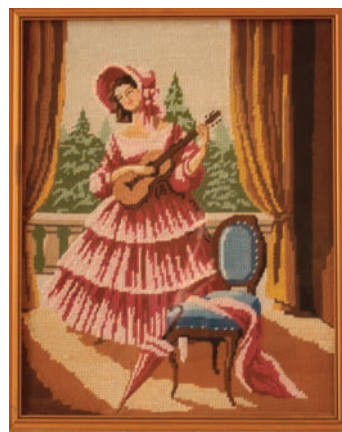
Dérnyé című gobleinem

A Szepes Gyula Művelődési Központban működő irodalomkedvelők klubjának tagja vagyok, szeretek alkotótársaimmal találkozni, jól érzem magam a társaságukban.